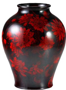
Fritlagt fotografi, dvs. baggrunden er fjernet